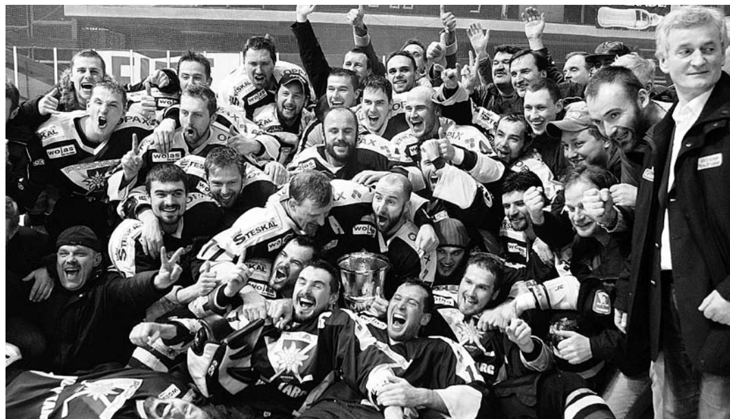
Mistrz Polski 2007 – Podhale Nowy Targ