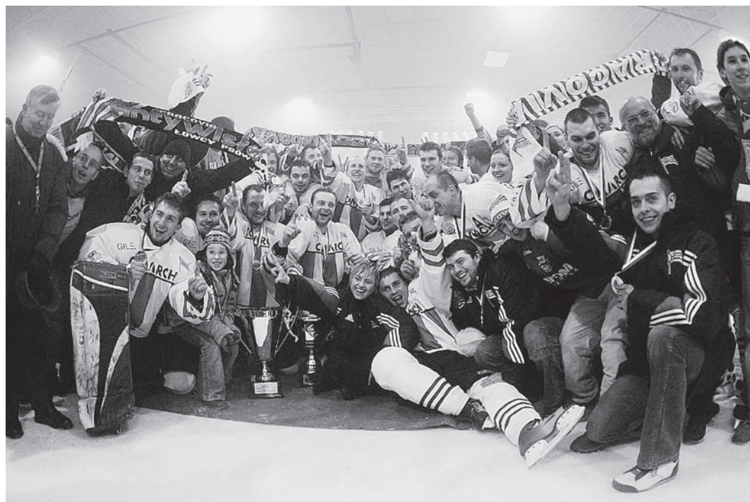
Mistrz Polski 2006 – Cracovia