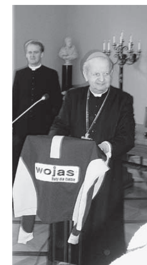
27 kwietnia 2007 nowotarscy mistrzowie zostali przyjęci w Krakowie przez kardynała Stanisława Dziwisza